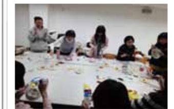
教師實際操作使用媒材進行輔導