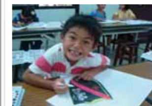
學生以繪畫表達自己的想法、抒發內在情緒