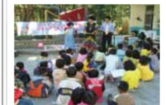
戲劇宣導防疫觀念