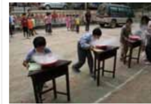
團隊活動釋放學童情緒壓力