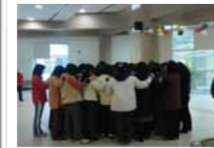
受災學校教師支持性團體