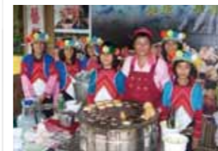
傳說中紅豆餅進入校園陪伴學童撫慰心靈