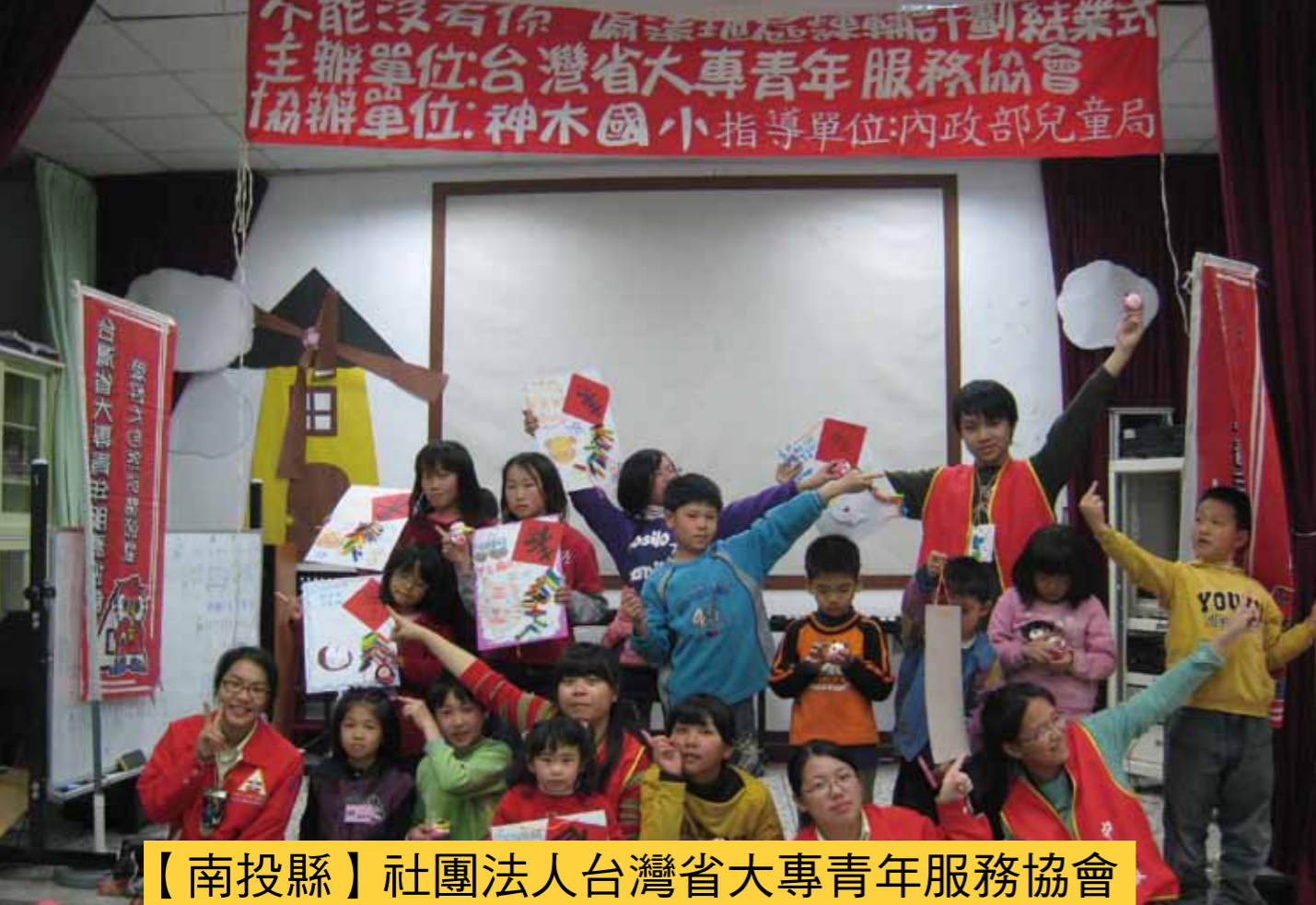
【南投縣】社團法人台灣省大專青年服務協會