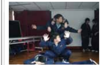
團體輔導中學生盡情揮灑展現自我