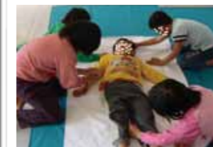
認識自己的身體，探索自我情緒