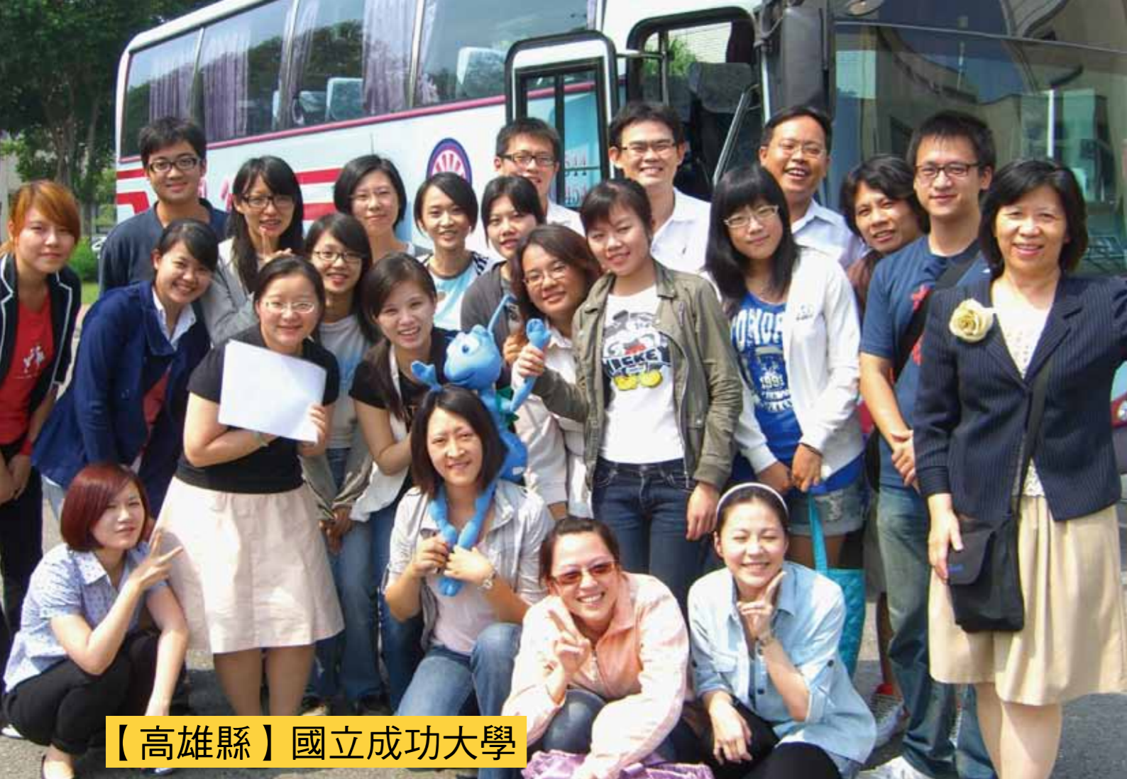
【高雄縣】國立成功大學