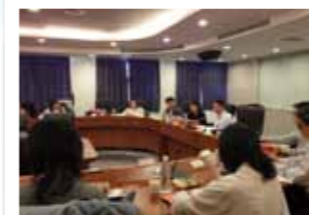
督導執行小組認輔單位工作報告