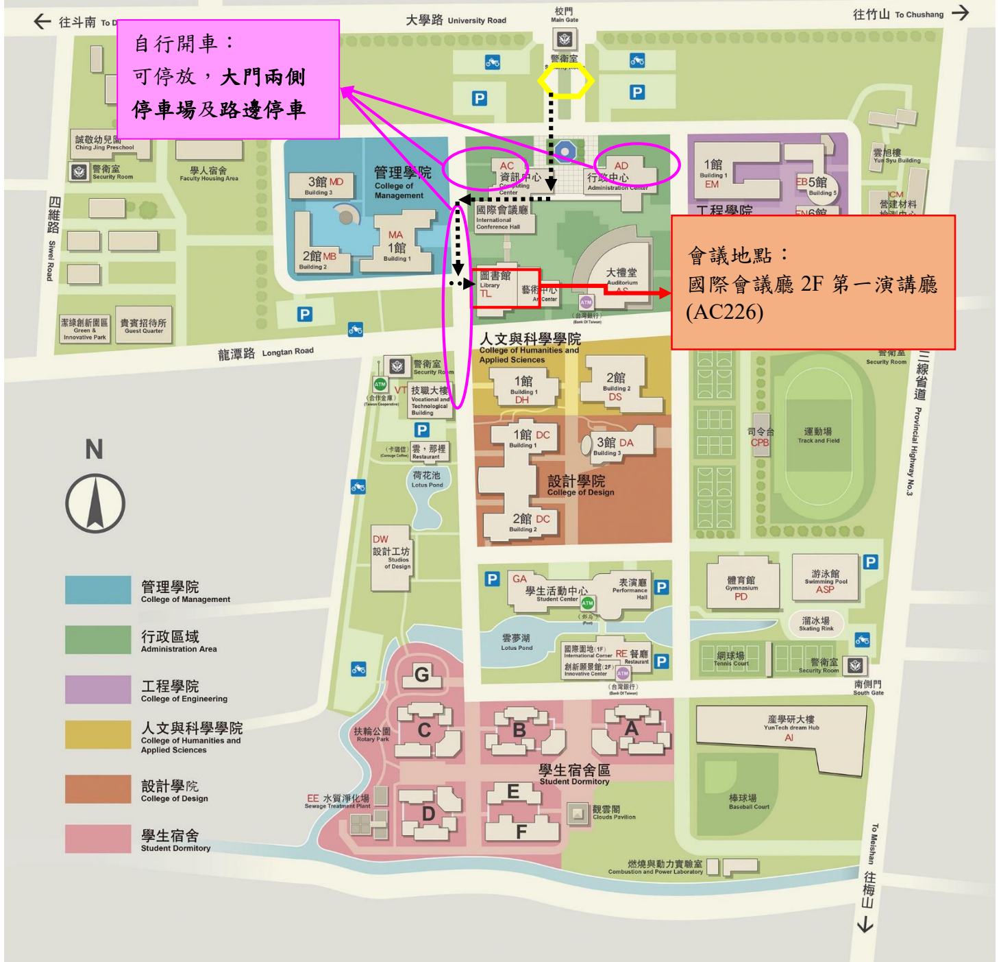
【附件二】會議及停車場位置圖